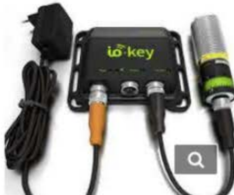
Der IO-Key bringt Sensoren per Plug&Play in die Cloud

Ein Stromanschluss oder eine 24-V-Stromversorgung genügt, weitere Hard- und Software ist nicht erforderlich. In drei Schritten haben Anwender die Möglichkeit, ihre Sensordaten online einzusehen und zu verwalten. Über das IO-Link-Protokoll erkennt das Gateway die Sensoren unabhängig vom Hersteller oder Typ – über 6.000 Geräte von 200 Anbietern. Damit lässt sich auch vorhandene Sensorik anbinden.